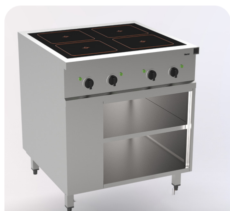
MH200121 - Vitrocéramique avec détection de pot