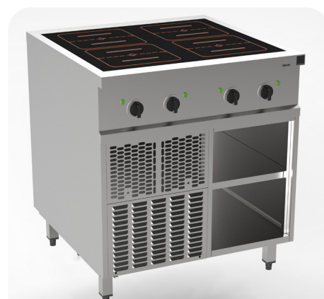
MH200221 - Induction 4 zones multizone