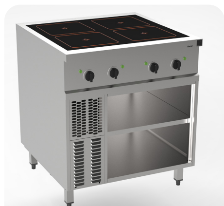
MH200201 - Induction 4x bobines rondes

Les tables de cuisson encastrées et les grands rayons faciles à nettoyer dans le soubassement sont des exemples de normes ergonomiques et hygiéniques les plus élevées. Des cadres supplémentaires pour une fermeture murale hygiénique sont disponibles en option.